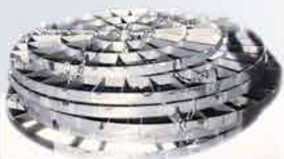
Дестилатор с кожухотръбен теплообменник