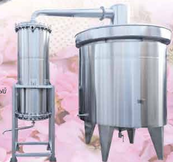
Distiller with heatexchanger