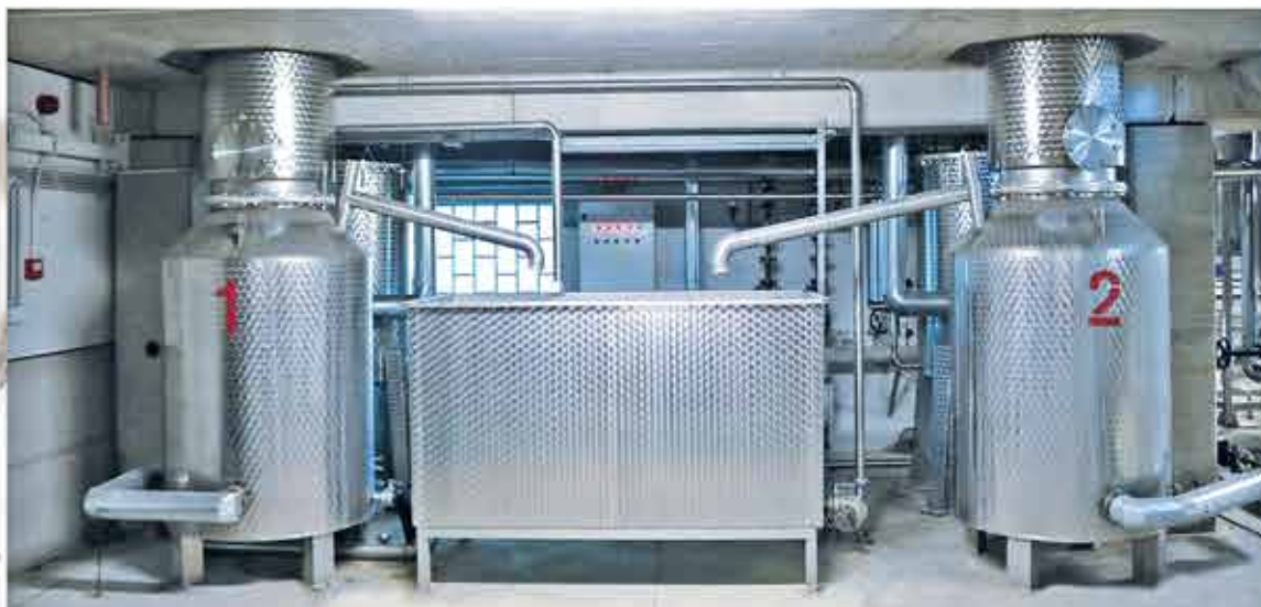
Кохобационни колони със съд за кубов остатък (ашлама) Колонны когобации с резервуаром для кубовый остаток (шлам) Cohobation columns with cube residue (graft) tank