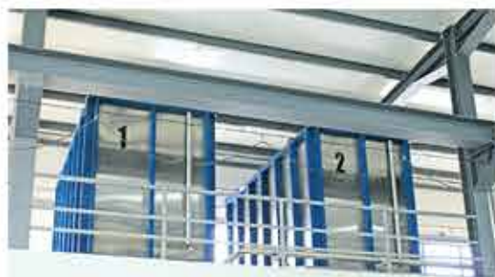
Изгледы Дестилерия за етерични масла/ Просмотров Завод эфирных масел/ Views Distillery for essential oils