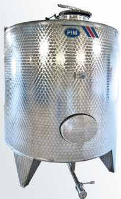
Резервоар/ Резервуар/ Tank