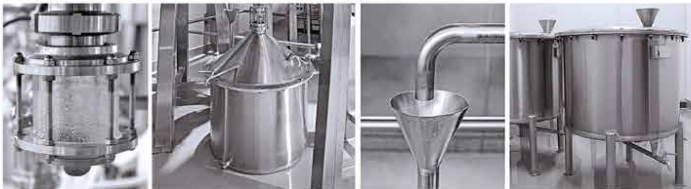
Фунарно стъкло Огнеупорное стекло (окно) Furnace glass